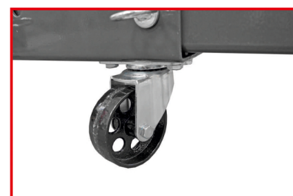
METALOWE KOŁA UŁATWIAJĄCE PRZEMIESZCZANIE