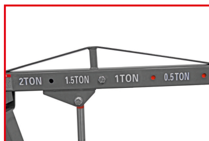
ZMIENNA DŁUGOŚĆ RAMIENIA 950 mm - 1490 mm