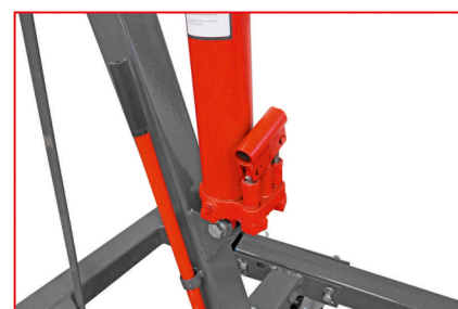
MOCNY SIŁOWNIK HYDRAULICZNY

UDŹWIG: 2000 kg MIN. WYSOKOŚĆ: 0 mm MAX. WYSOKOŚĆ: 2300 mm WAGA: 85 kg