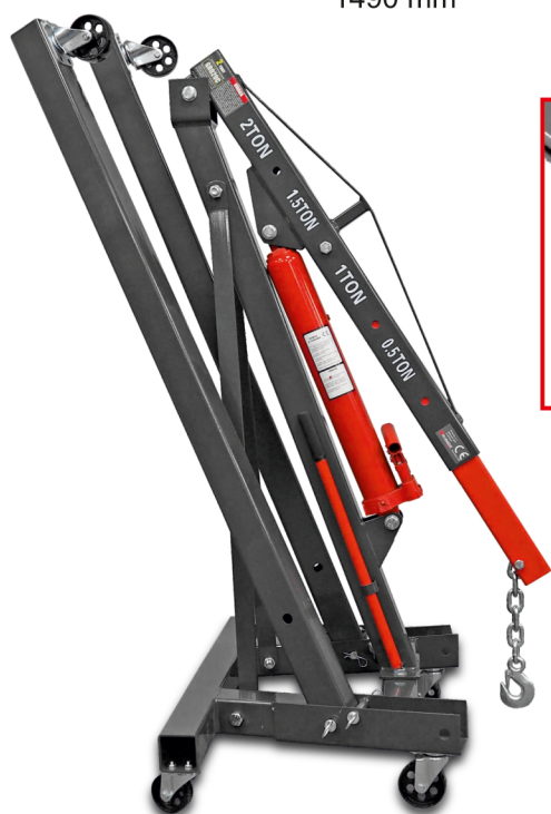
KOMPAKTOWE WYMIARY PO ZŁOŻENIU