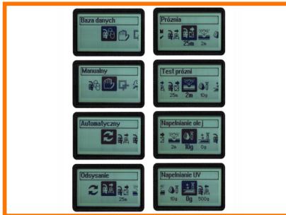
AUTOMATYCZNE CYKLE OBSŁUGI