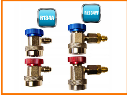
DWA KOMPLETY ZŁĄCZEK R134A 1234YF