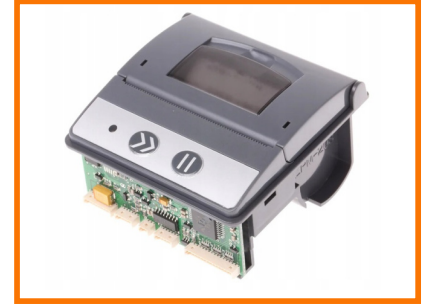
DRUKARKA W STANDARDZIE