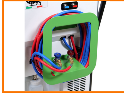
PRZEWODY 7,5 m