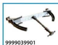
zestaw do obręczy bez otworu centrującego