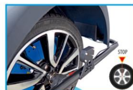
AUTOMATYCZNE POZYCJONOWANIE KOŁA W MIEJSCU NIETYWAŻENIA