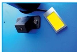
WSKAŹNIK LASEROWY ORAZ OŚWIETLENIE WNĘTRZA KOŁA